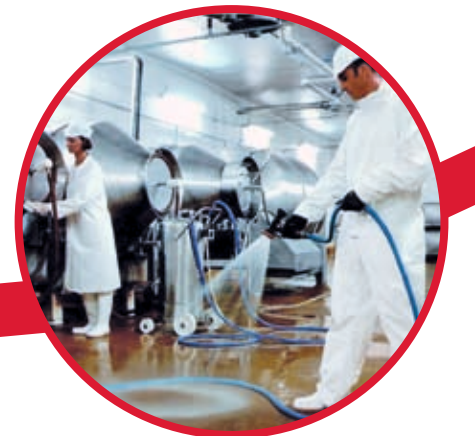
Entreprises de propreté